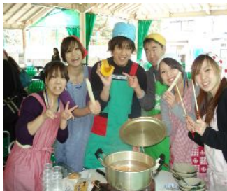
2日目 山梨県の伝統料理 ほうとう作り

私は、今回2年生サポーターとして宿泊研修に参加させてもらいました。先生からサポーターの役割を頼まれた時は、顔には出さなかったが、本当に心から嬉しく思いました。反面、去年の先輩方のサポーターぶりがあまりに素晴らしかったので、自分に務まるのか不安でいっぱいでした。私も引き受けた以上は全力を尽くして頑張ろうと強く感じました。練習や準備が始まり、HRでの説明などで1年生の皆さんが私たちサポーターの話に真剣に耳を傾けてくれているのがわかりました。サポーターと1年生の思いが通じたのか、宿泊研修当日は、山梨についてみると、あいにくの雨が見事に止み、神様は皆の日ごろの行いを見ている！と感じました。キャンプファイヤーも研修報告会もほうとう作り、どれも有意義で大成功だったと思います。活動では1年生の皆さんの一生懸命さが伝わってきて、それがなにより嬉しかったです。