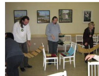
シロフォン・ブリッジ?

次のような教材を使います。まずウォーム・アップにクレヨンや絵具、紙を使って活動します。授業では主に楽器を使用します。グランド・ピアノ、打楽器、弦楽器、アコーディオン、金属製の楽器、木製の楽器、プラスチック製の楽器などです。