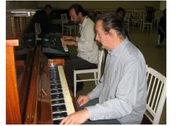
キーボード奏者とピアノで即興演奏する私

「写真を数枚、添付しました。これは昨年10月、ロシアで行なった授業の写真です。音楽セラピーのトレーニングの様子を写したものです。音楽は即興的に作られ、演奏されました。その目的はself expression (自己表現), sharing (共有する、連携する), listening to other player(s) (他の人の即興を聞く) ことです。6人の人がピアノを弾いているのは、いろいろな「社会的コントロール」を感じるままに表現することを試みています。音を出すことが最後に言葉へと発展させるエクササイズです。いまワークショップ in Tokyoの内容を考えています。次の機会にまた書きます。」