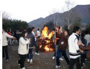
1日目 西湖湖畔でのキャンプファイヤー

今回サポーターとして参加して、自分自身が楽しまなければ子ども達に楽しさは伝わらないこと、相手にわかりやすく説明する難しさを改めて身にしみて感じ、私自身の課題だと感じた。保育者になりたいという同じ夢を持った仲間と一緒に学び、成長する私自身の「ステップアップ」を、これからも目指していきたい。そして、1年生を影ながら応援していければと思う。