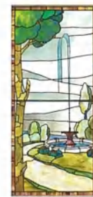
学園記念ホール スタンドグラス